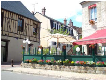
Hôtel du Sauvage

Prendre à gauche en sortant du syndicat d'initiative.